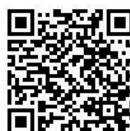
Demo 2, förenklad version

I broschyren Electrolux Vision är verklighet, finns mer att läsa. Gå in på www.electrolux.se/professional och ladda ner den. Om du hellre vill ha en tryckt broschyr kontakta oss gärna på 0372-665 01 så skickar vi en till dig.